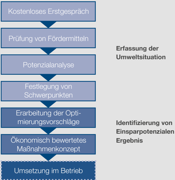
Ablauf der Potenzialberatung

Der Effekt: Sie sparen Kosten und schützen die Umwelt!